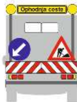
Slika 1 - Način obilježavanja ophodarskog vozila

Sva ophodarska vozila tvrtke CESTE-RIJEKA d.o.o. Kukuljanovo koja se koriste kao ophodarska vozila su obilježena i opremljena sukladno Pravilniku o ophodnji javnih cesta što se dokazuje kontrolnim pregledom ophodarskih vozila.