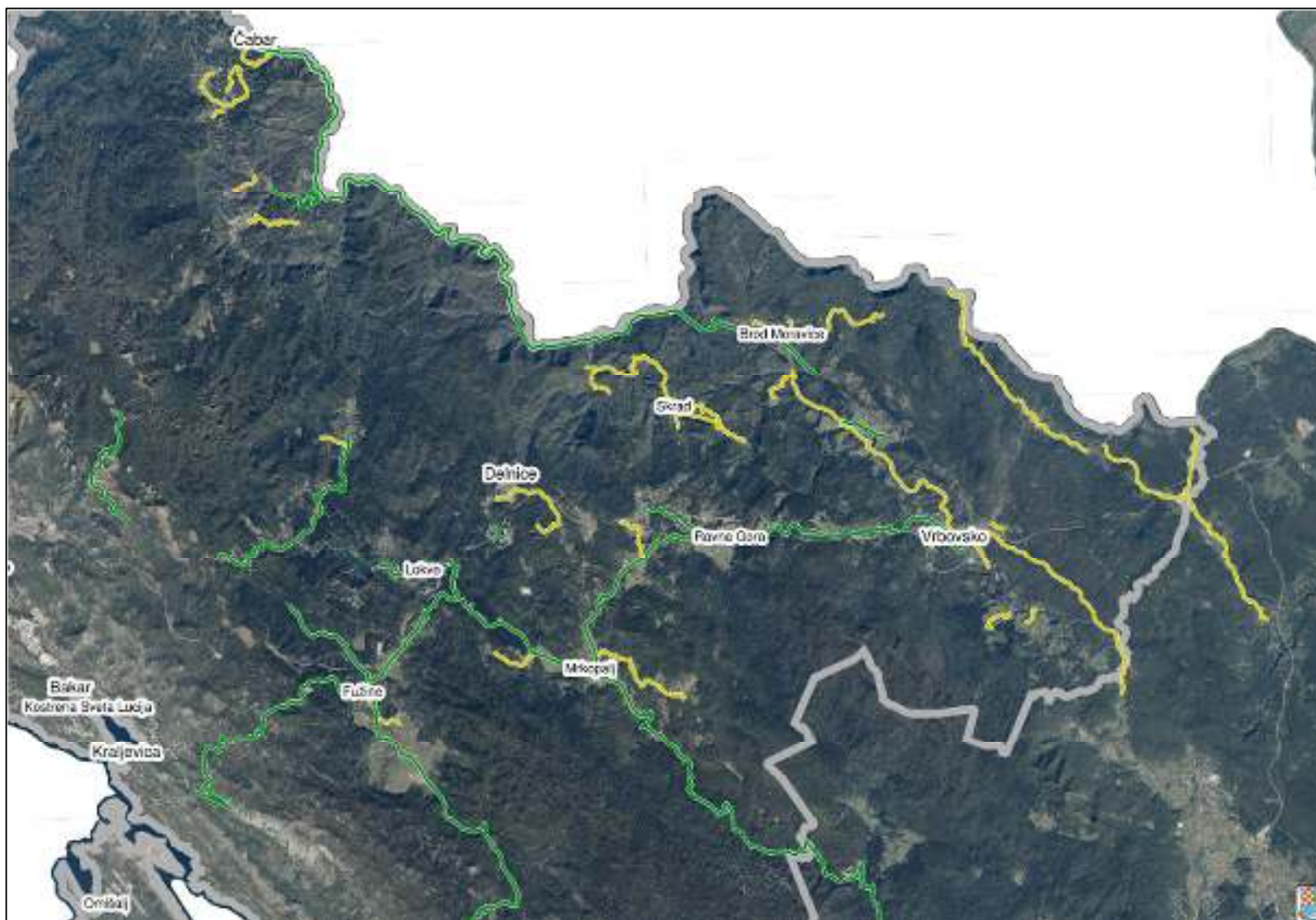
Slika 2 - Prikaz ophodarskih dionica (bez dionica međuvožnje) - Nadležarija Delnice