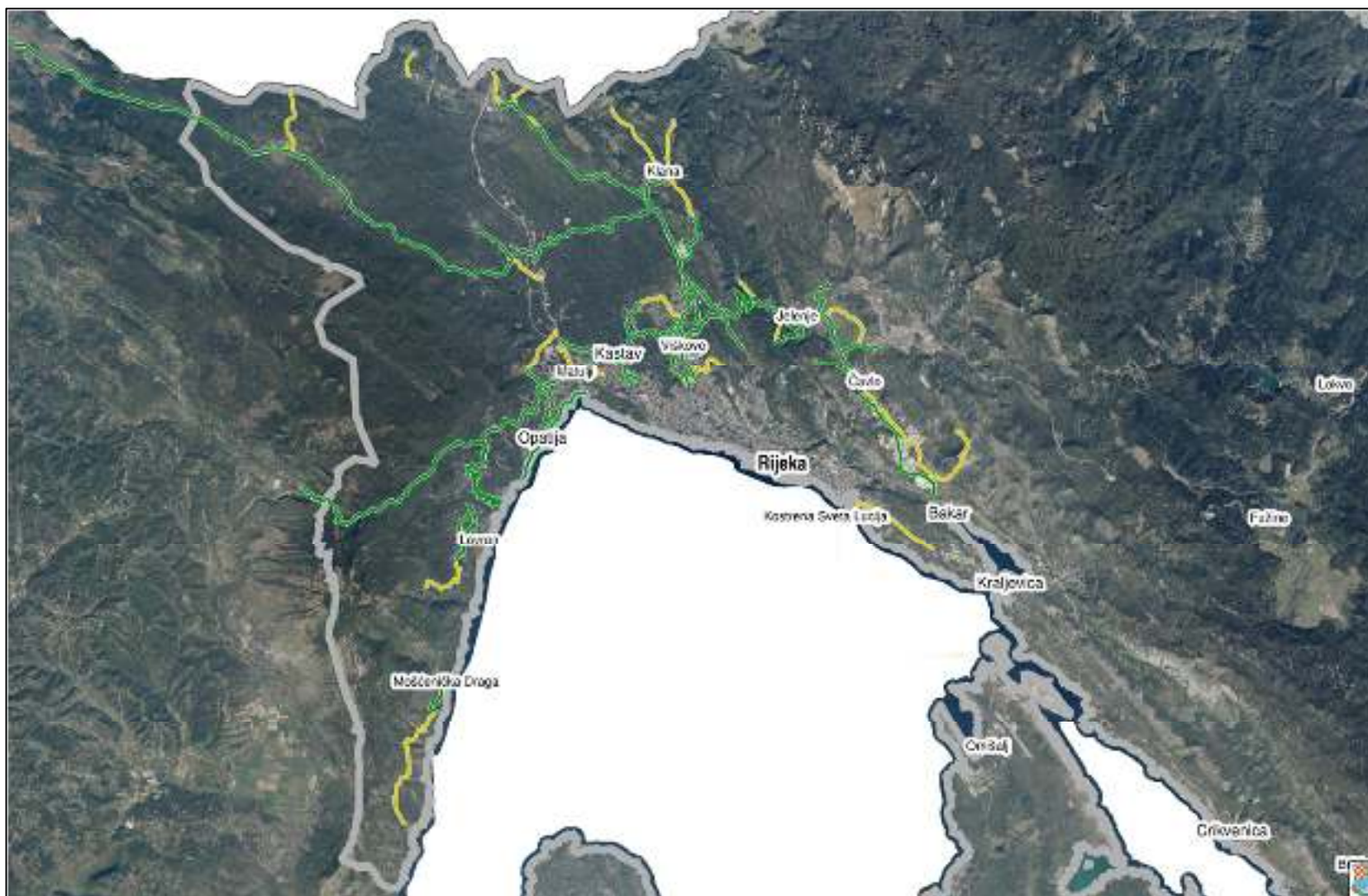
Slika 3 - Prikaz ophodarskih dionica (bez dionica međuvožnje) - Nadcestarija Rijeka